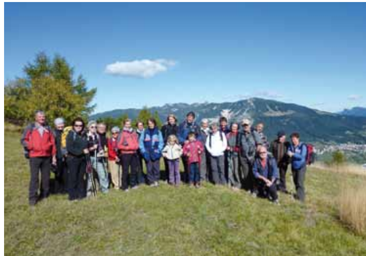
Monte Finonchio - Gruppenbild

Am 9. Oktober 2011 stand der Monte Finonchio auf dem Jahresprogramm, gleichzeitig die letzte Gipfeltour des Jahres. Von Moietto, einer Fraktion von Rovereto am Osthang des Etschtales ging es steil durch den Wald zur Malga Finonchio und dann in angenehmer Steigung durch Busch- und Wiesengelände zum Gipfel des Monte Finonchio, welchen leider zahlreiche Sende-