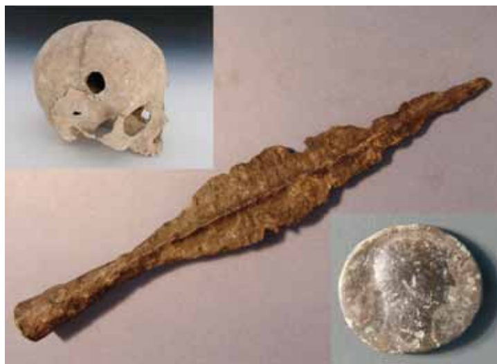
1 - Teschio con trapanazione (Alto Medioevo)

Presso il maso Ziegler sono riconoscibili resti di strutture del primo Medioevo, un tempo in cui la conca di Merano era aspramente contesa da popoli germanici, come ad esempio i Baiuvari e i Longobardi.