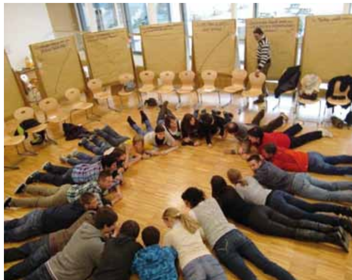
Marlinger Jugendliche und Mitglieder des Gemeinderats spielen „Pferderennen“.

Die Beteiligung von Jugendlichen ist der Gemeinde Marling ein ernstes und wichtiges Anliegen. Ein großer diesbezüglicher Schritt wurde vor kurzem unternommen, indem Gemeinde und Jugenddienst Meran gemeinsam mit zahlreichen Vereinen und in enger Zusammenarbeit mit dem Südtiroler Jugendring (SJR) das erste Jugendforum organisierten. Zu diesem luden sie Jugendliche ab 12 Jahren ein, um ihnen die Möglichkeit zu geben, ihre Gemeinde kritisch zu hinterfragen und ihre diesbezüglichen Wünsche und Anliegen zu deponieren. 16 Jugendliche sind der Einladung gefolgt und haben sich am 26. November einen ganzen Nachmittag bis in den Abend hinein intensiv mit ihrer Gemeinde