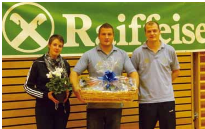
Sieger der Potzerrunde 2011