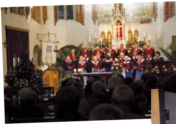
Kirchenkonzert des Kirchenchores Marling anlässlich des 100 Jahr – Jubiläums der Behmann Orgel