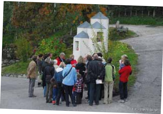
Bildstöcklwanderung: beim Bildstöckl in der Mitterterzerstraße