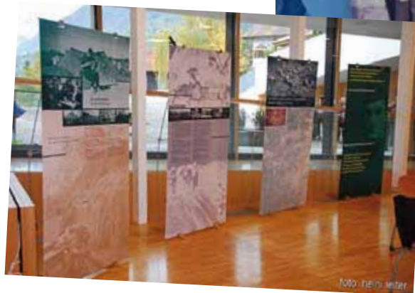
Wanderausstellung „Ich war im Krieg“ in der Aula der Grundschule