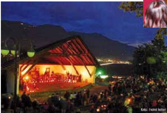
Laternenfeier: Abschluss der Kulturtage mit dem Laternenumzug des Kindergartens